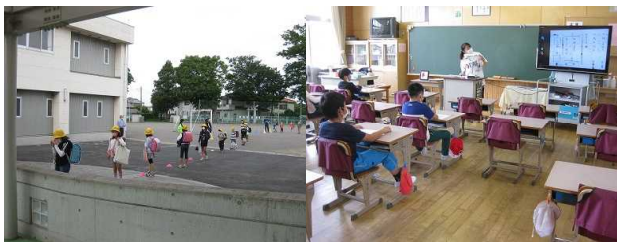
【間隔を空けての登校】 【分散登校の教室】

※野木町に各方面から寄付していただいたマスクが子どもたちに配布されました。ありがとうございます。